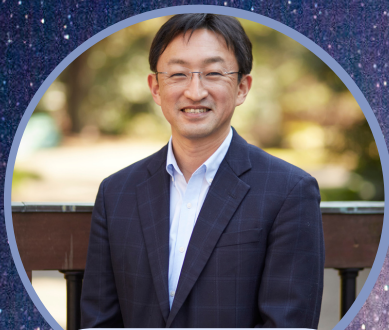
東京大学 東洋文化研究所 新世代アジア研究部門 教授